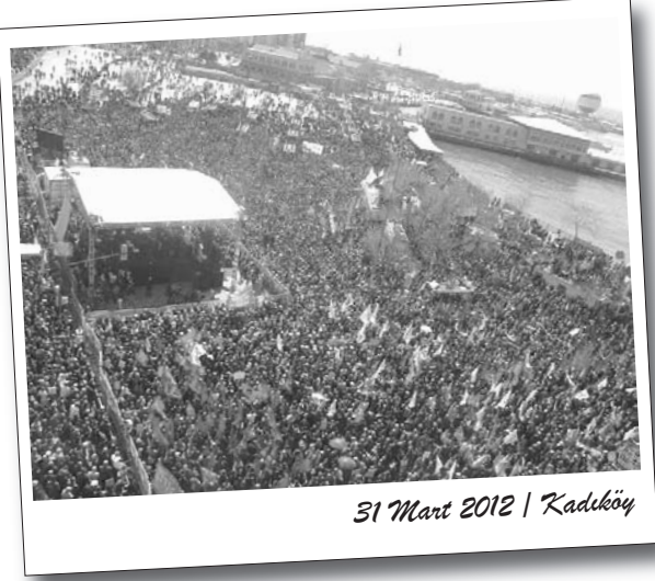
31 Mart 2012 | Kadıköy

Sivas Katliamı davasının zamanaşımına uğratılarak aklanması 31 Mart günü İstanbul Kadıköy'de onbinlerce kişinin katıldığı mitingle protesto edildi. İstanbul'un birçok ilçesinin yanısıra Eskişehir, Balıkesir, Yalova, Bursa gibi çevre illerden gelerek mitinge katılan Alevi emekçileri ile ilerici ve devrimci güçler, katliamları aklayan düzen yargısına tepki göstererek katliamcı devletten hesap sorma kararlılığını haykırdılar.