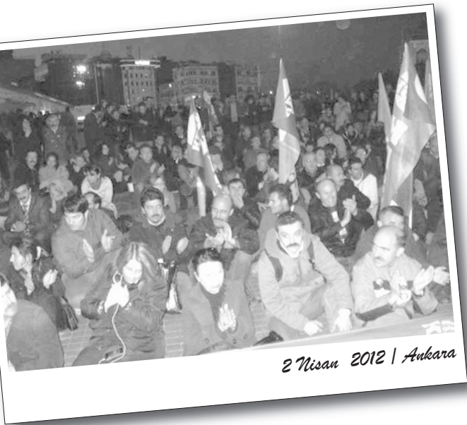
2 Nisan 2012 | Ankara

Bakan yardımcısının gelmesiyle KESK yöneticileri eylemi sonlandırdı. KESK yöneticilerine DİSK Genel Sekreteri Adnan Serdaroglu da destek verdi. İşgali sonlandıran KESK'liler mücadelelerini sürdüreceklerini belirttiler.