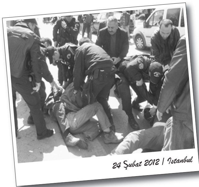
24 Şubat 2012 | İstanbul

Diğer yandan, saldırı anını görüntüleyen işçilerin makinesine el koyan polis görüntüleri silerek polis terörünü gizlemek istedi.