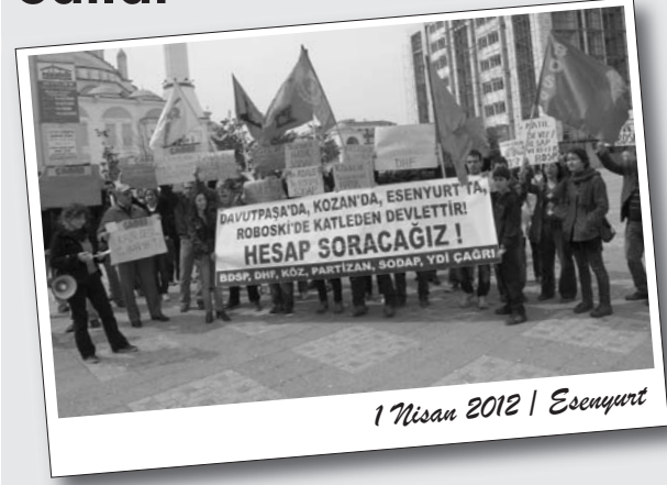
1 Nisan 2012 | Esenyurt

Esenyurt'ta bir araya gelen ilerici ve devrimci kurumlar iş cinayetlerine, taşeronlaştırmaya, güvencesiz çalışmaya ve güvencesiz yaşamaya karşı bir eylem gerçekleştirdi.