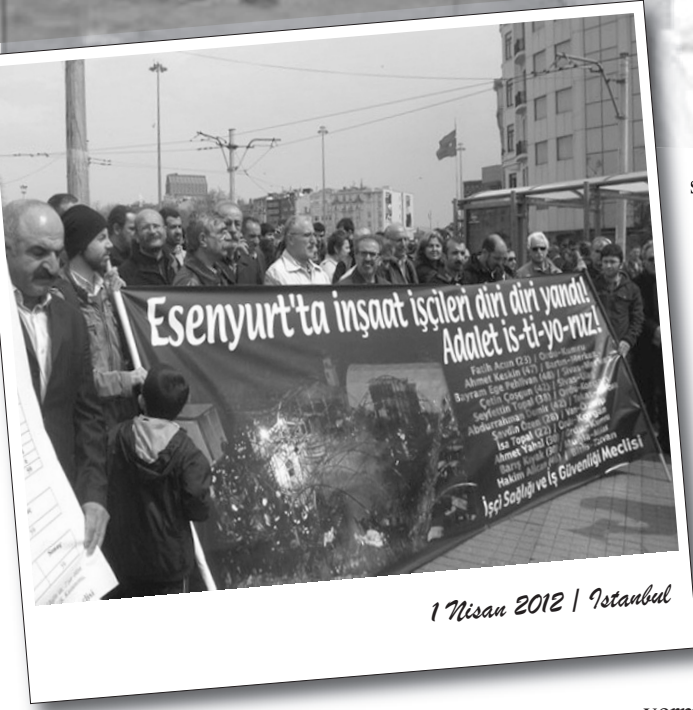
1 Nisan 2012 | İstanbul

Mart ayına ilişkin işçi sağlığı ve meslek hastalıkları değerlendirmesini açıklayan İstanbul İşçi Sağlığı ve İş Güvenliği Meclisi , inşaat sektöründeki işçi ölümlerine dikkat çekti.