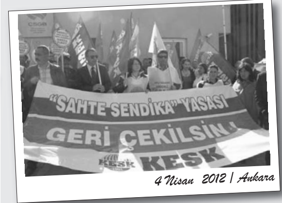
4 Nisan 2012 | Ankara

4688 Sayılı sahte sendika yasası 4 Nisan akşamı TBMM'de oylanarak kabul edildi. KESK'e bağlı sendikaların yöneticileri ise "Sahte Sendika Yasası"na karşı eylemlerine Çalışma Bakanlığı işgaliyle devam etti.